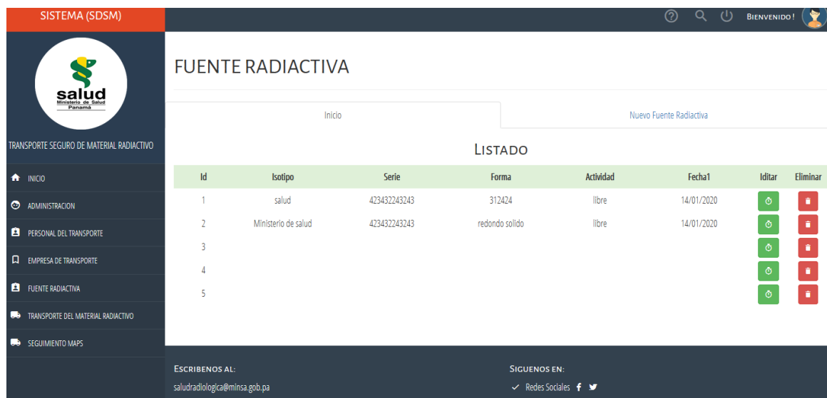
Figura 8. Módulo Fuente Radiactiva

La AR, le da la oportunidad de ver las fuentes enviadas por día, semanalmente, mensuales o anuales y realizar reportes de forma, actividad y cotejar números de series.